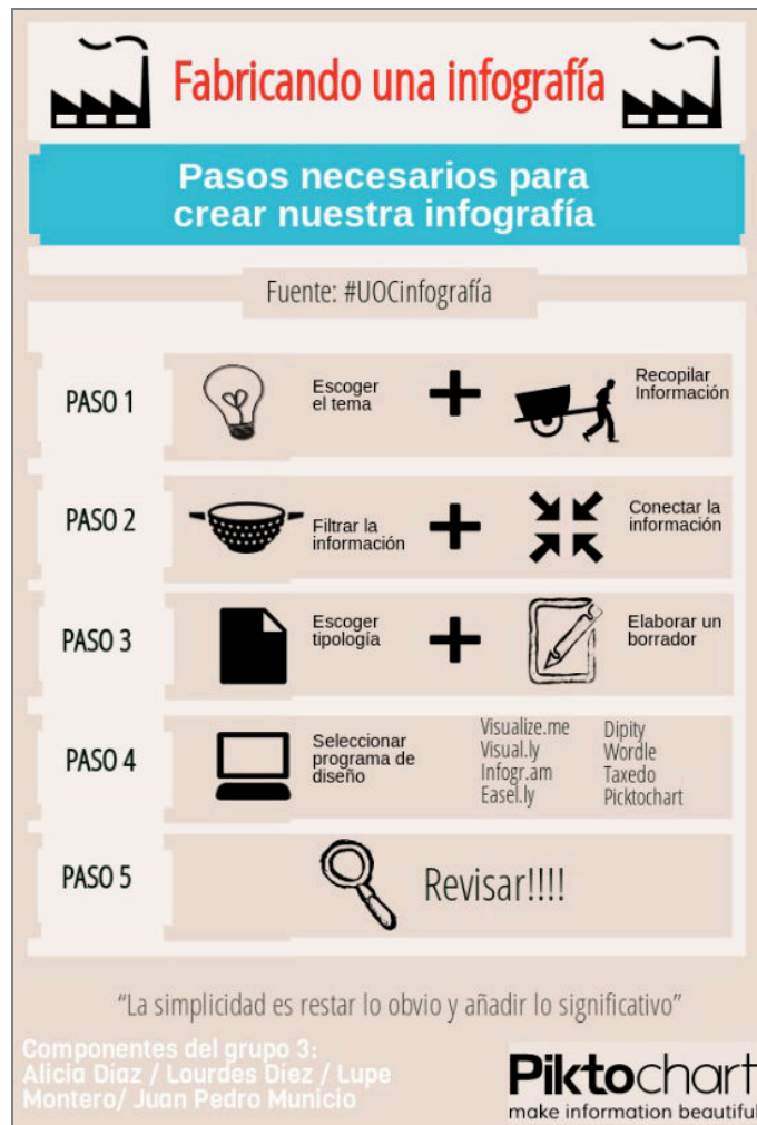
Figura 1. Fabricando infografías.

» Dos ejemplos de infografías sobre cómo hacer infografías: