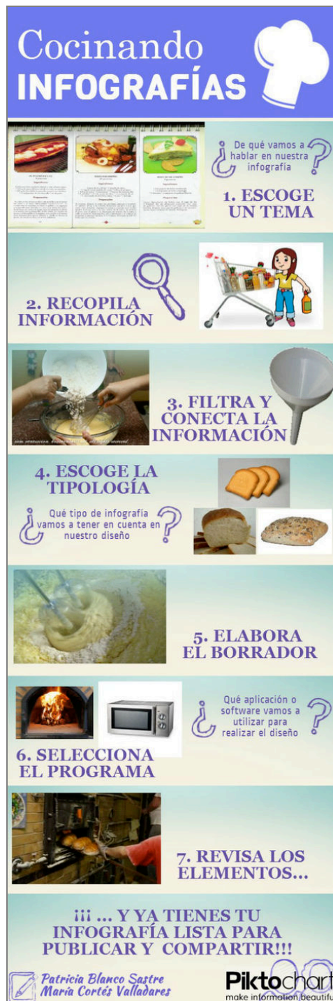
Figura 2. Cocinando infografías.